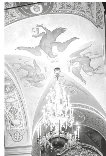
Внутреннее убранство одного из храмов монастыря

Но причём здесь Фиваида? Дело в том, что на заре утверждения христианства состоялся «великий исход» отшельников в египетскую пустыню, где постепенно сложилась своего рода зона расселения святых от-