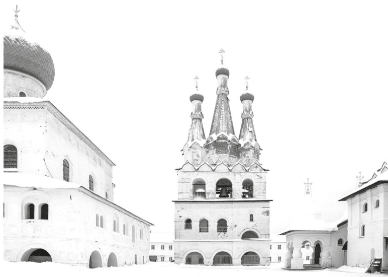
Александро-Свирский монастырь известен памятниками архитектуры XVI века