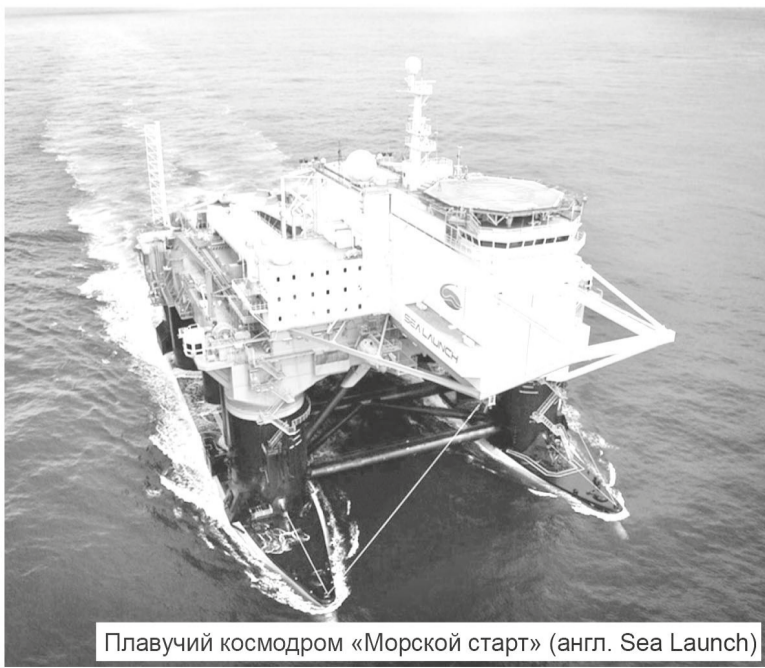
Плавучий космодром «Морской старт» (англ. Sea Launch)

западным бизнесменам, заводчанам пришлось продавать акции, и постепенно, шаг за шагом, завод допускал к себе иностранный капитал. Тем не менее в эти годы были достроены пять лесовозов-пакетовозов водоизмещением 5 тысяч тонн (типа «Капитан Лусь»). К 1998 году уже более 70 % акций находилось в руках норвежцев. С 23 июля 1997 года завод фактически стал принадлежать концерну «Квернер АС» и сменил название – стал открытым акционерным обществом «Квер-