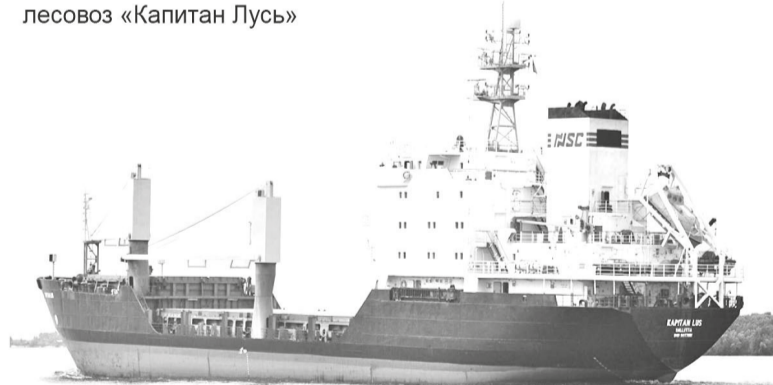
Унифицированный лесовоз «Капитан Лусь»

годы всё обслуживание флота (докование, ремонт, снабжение) Балтийского морского пароходства в значительной части было сосредоточено в Выборге. Это способствовало развитию городской инфраструктуры и росту численности населения Выборга.