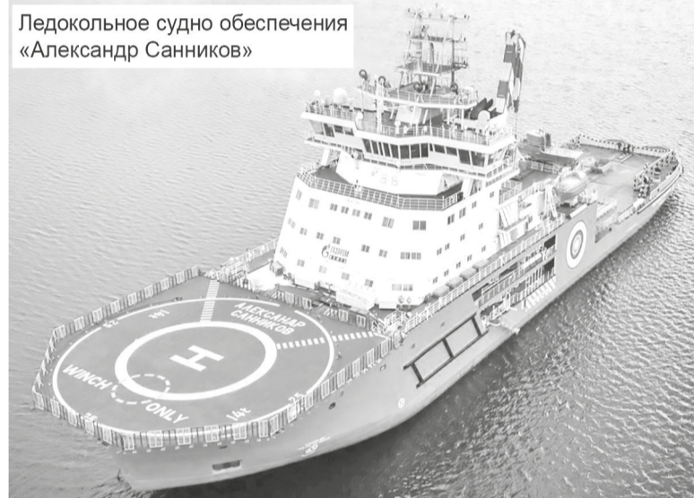
Ледокольное судно обеспечения «Александр Санников»

последние десять лет строят полноценные суда для работы в Арктике. Выборгский судостроительный завод уверенно занимает лидирующие позиции в строительстве судов ледового класса. На предприятии построены три дизель-электрических ледокола типа «Владивосток». В 2015 году на заводе по заказу «Газпромнефти» было заложено, а 6 декабря спущено на воду многоцелевое ледокольное судно обеспечения «Александр Санников» мощностью 22 МВт, построенное для работы на Арктическом терминале Новопортовского месторождения, расположенном на западе Обской губы на полуострове Ямал.